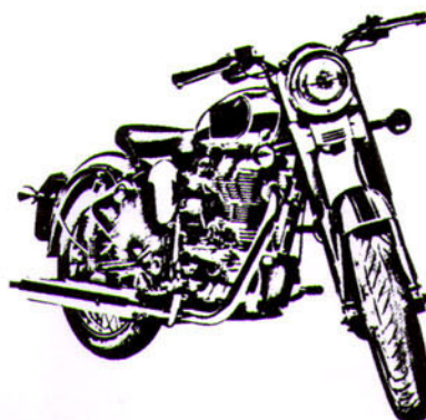
Per A.d.S. e C.R.S.